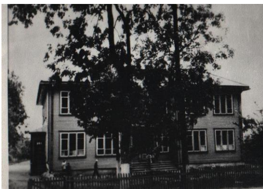
Pradinė mokykla 1961 m. Stoties g.

Ar žinote, kad Stoties gatvėje buvo įsikūrusi Senoji Plungės miesto pradinė mokykla, žmonių vadinama „muzikantine“? Pastatas miesto parke, prie paradinių vartų, nebuvo pritaikytas mokyklai: medinis, gerokai apipuvęs. 1933 m. Stoties gatvėje buvo pastatyta nauja, medinė, dviejų aukštų pradinė mokykla. 1954 m. pradinė mokykla perorganizuota į septynmetę. 1961 m. čia buvo paliktos tik pradinės, o vyresnės klasės perkeltos į buvusius Kapucinų rūmus įsiliejo į priaugančią Plungės aštuonmetę mokyklą.