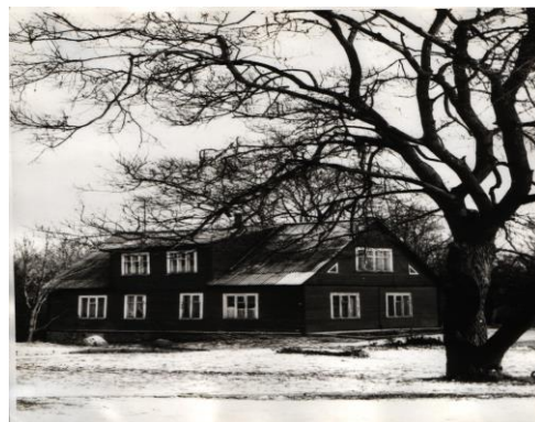
Pradinė mokykla buv. J. Janonio g.