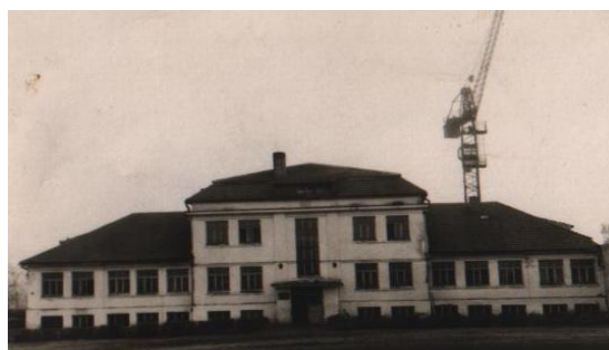
Senoji gimnazija 1940-1955 m.m.

1936 m. sujungus valstybinę ir kapucinų progimnazijas, šiame pastate Plungės valstybinė progimnazija, išaugusi į gimnaziją, vėliau pervadinta vidurine mokykla, veikė iki 1961 m.